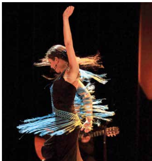
« Chaos » Marie Gache • Chantier 2016/2017