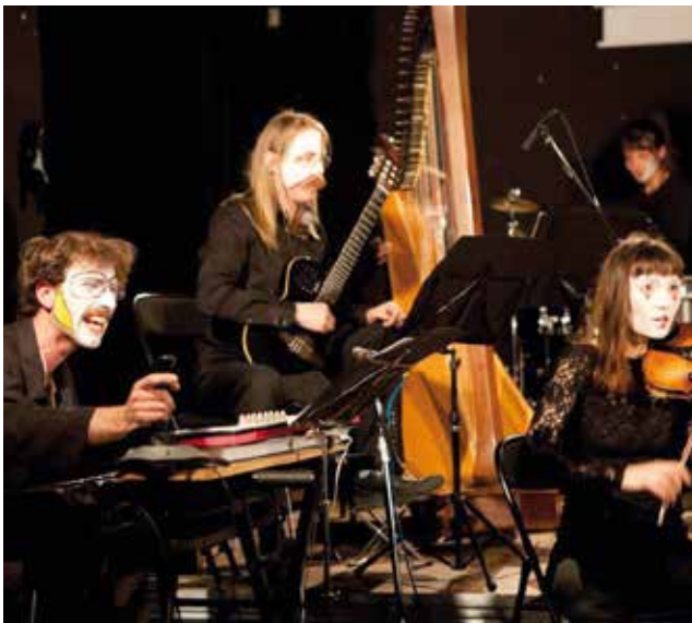
« Trou de ver » Grand Sbam ■ Chantier 2012/2013