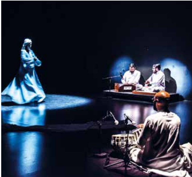
« Noor » • Chantier 2018/2019