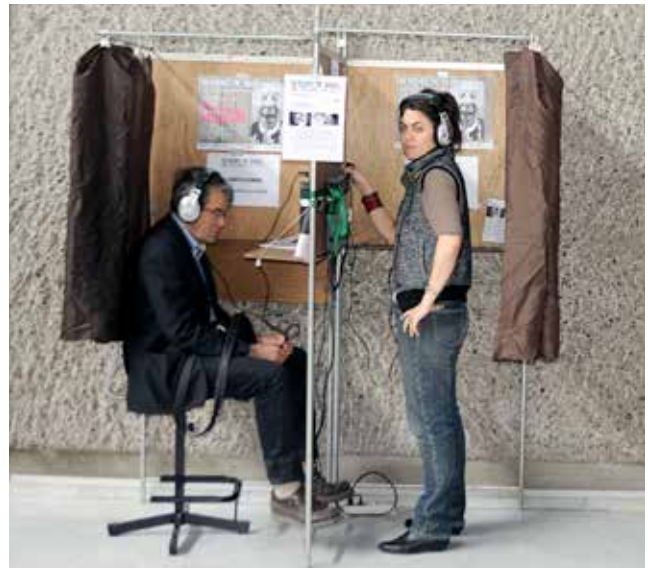
« Le confessionnor » P. Maucort & J. Beressi ■ Chantier 2011/2012